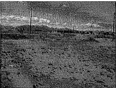
Abra Pampa April 2011 003.JPG 1485K