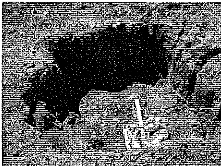
Abra Pampa April 2011 005.JPG 1474K