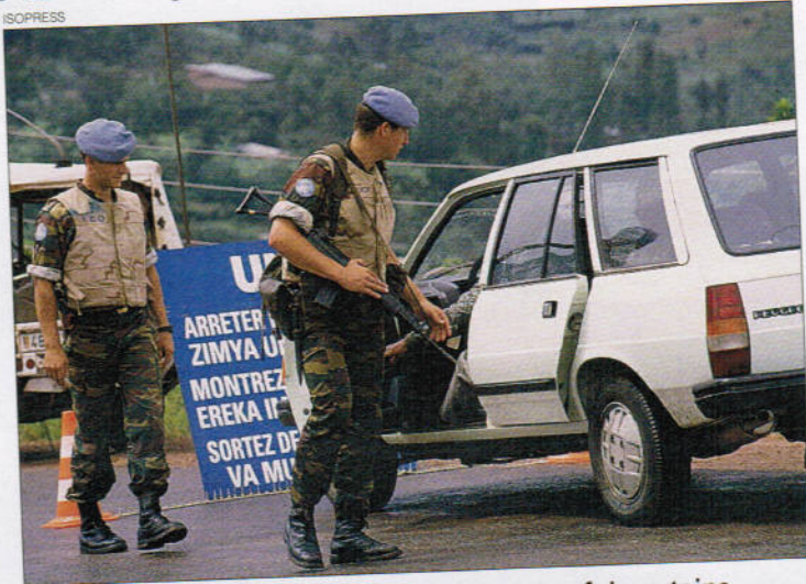
Aux contrôles routiers se produisent parfois certains incidents, exploités aussitôt par la radio des Mille Collines, très écoutée à Kigali.

Quelques semaines plus tard, un officier supérieur des FAR (Forces armées rwandaises) a été, affirme le radio, harcelé dans sa résidence par des éléments belges de la Minuar. « En fait, l'un de nos sergents s'est fait presque écraser par une jeep dont les