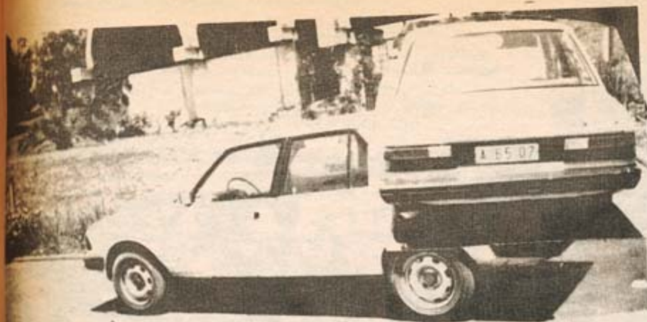
Modoka n° A 6507 ya Minaffet nayo iri mu ziriwe zitunda amabandi yo gutsemba ngo "Abaparmehutu" da!!.