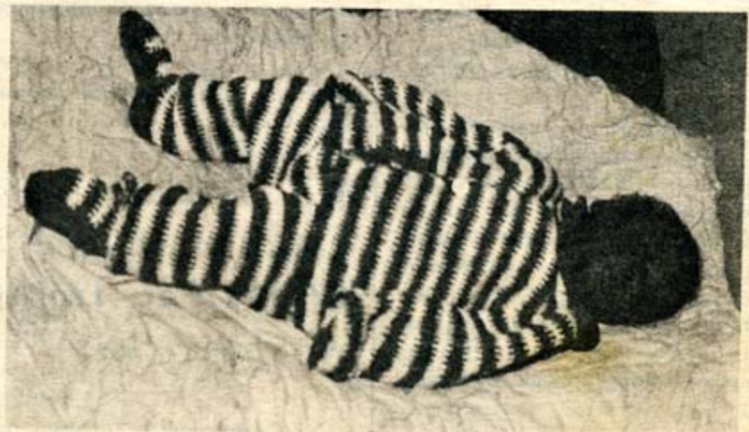
Nitwa Docteur. Navutse ku wa 10/04/1990. Uzamenya isaha navukiye, azahabwa ifatabuguzi rya KANGURA umwaka wose.