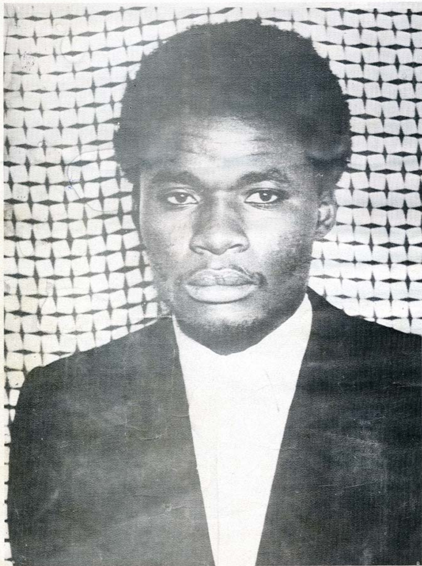
Umuyobozi wa KANGURA