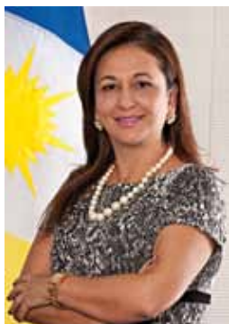
Kátia Abreu Kátia Regina de Abreu DEM – Tocantins