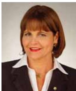
Ana Júlia Carepa Ana Júlia de Vasconcelos Carepa PT – Pará