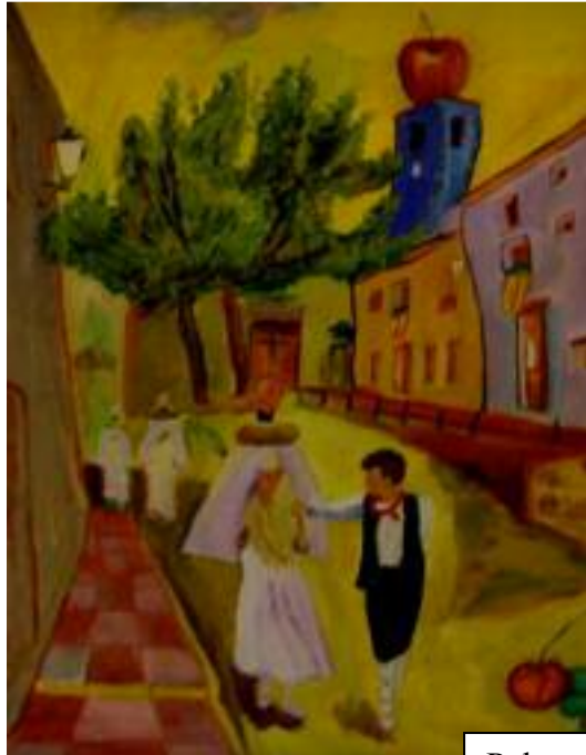
Palmeral. El “Pa Beneït

Todo eso y mucho más tenemos que agradecer a los integrantes de la Comisión de Fiestas de este 2008, que rayaron a la altura de la mejor nobleza: la que agasaja con la sutil elegancia de hacerte creer que eres tú el que le favoreces. Porque si bien es cierto que nuestros asociados contribuyeron al esplendor de un acontecimiento para el recuerdo, no es menos cierto que ellos pusieron el esfuerzo y los medios, para que de ahora en adelante podamos decir ¡TORREMANZANAS MON AMOUR! (3 DE MAYO DE 2008).