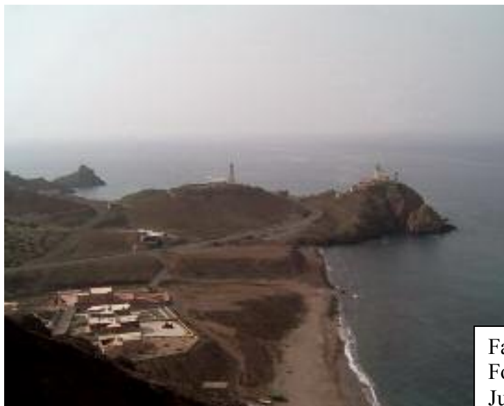
Faro de Cabo de Gata. Junio 2006

Dice Goytisoló en la novela la patria chica puede elegirse, a él le gusta la claridad de este cielo y de este mar, la visitaba cada año, estuvo en un varios viajes, uno en 1959, se le sirve para escribir la novela. Lo que sí hay que tener muy en cuenta es que este tipo de libros podían meterte en la cárcel como agitador y aplicarte el ley de Orden Público por delitos contra la seguridad del Estado, por ello, Goytisoló demuestra cierto valor, ahora testimonial de un pasado que no podemos ni debemos olvidar como puente al futuro, y más aun cuando esta novela pasa al cine y a la televisión como un documental, el de Nonio Parejo en 1984, que es una verdadera obra artística documentalista.