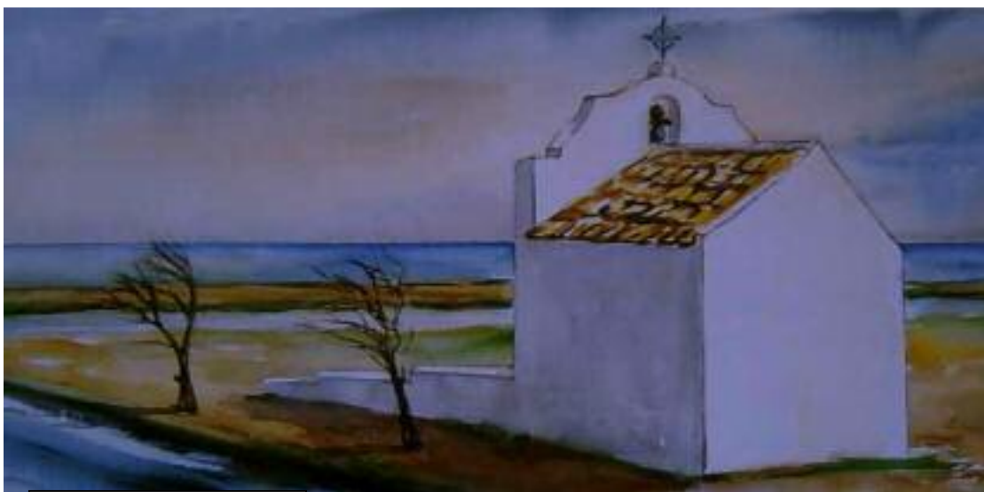
Ermitea Santa Pola