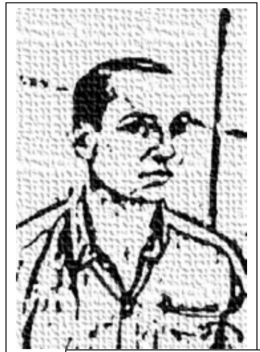
Por Ramón Fernández

Cuánto te admiro, y lamento aquel hecho que ocurrió, que a mi corazón lo paró, y a mi mente la dejó sin miles de nuevos versos.