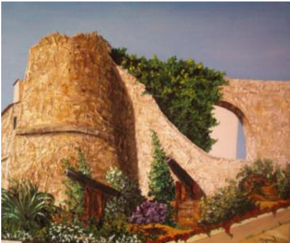
AYEN, Castillo de Calpe

—Pero a mí no me pasará. Lo importante es hablar. Aunque no sepas lo que estás diciendo. Aunque no sepas si es verdad o mentira. Nadie dejará de verme mientras no cierre la boca.