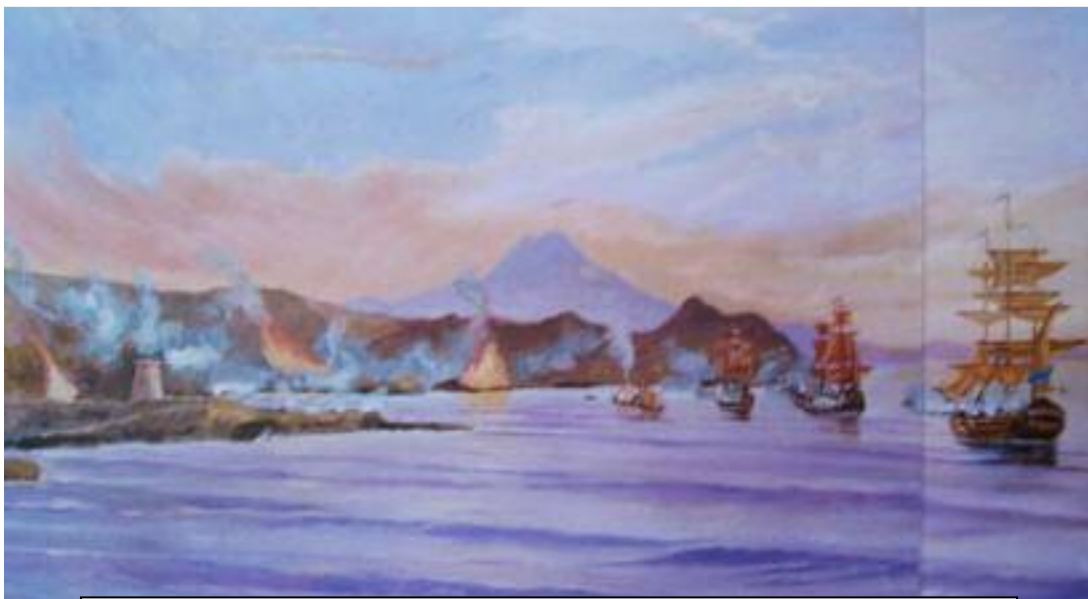
Ataque naval a la torre vigía de El Campello. Ramón Fernández (Depositado en el Museo Naval de Cartagena).

Luces brillantes y oscuras, aguarda el gitano de una guitarra, cubierta de velos, la gesta gitana, bailando las coplas... Carmen Amaya.